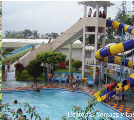
Hosterías Somagg y Las

La fuerza energética que produce la caída de 200 metros lineales del agua constituye un impresionante fenómeno natural apto para turismo de aventura y se localiza en el camino de los Chasquis a varios kilómetros de la ciudad de La Maná. La historia cuenta que sentado en un sillón de piedra los