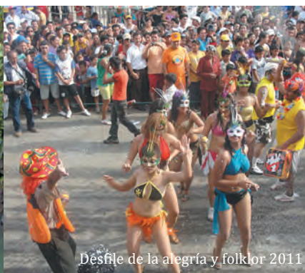
Desfile de la alegría y folklor 2011