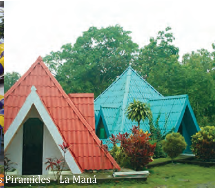
Pirámides - La Maná

Incas realizaba sus baños de purificación y energización con el agua que provenía de la chorrera.