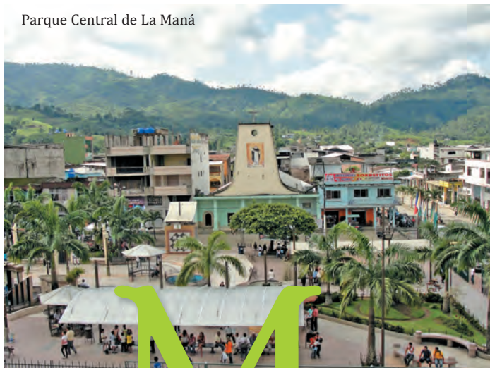
Parque Central de La Maná