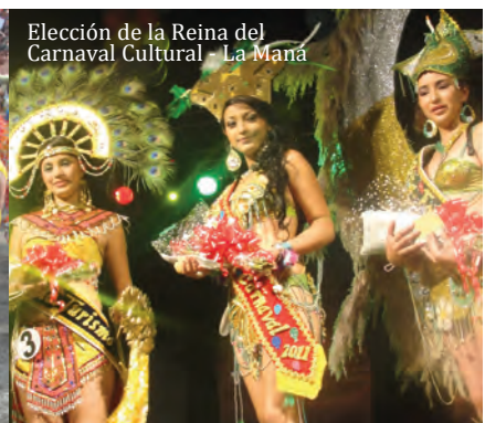
Elección de la Reina del Carnaval Cultural - La Maná