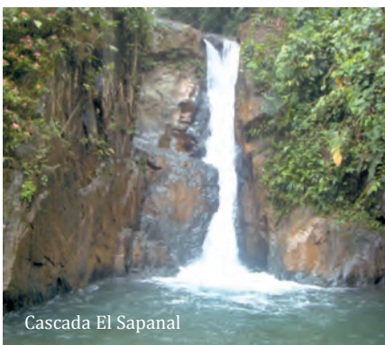
Cascada El Sapanal

El Feriado de Carnaval abre el espacio en el cual turistas nacionales y extranjeros visitan mayoritariamente la ciudad para celebrar la fiesta tradicional de "El Carnaval Cultural de la Maná" con alegría, unidad e identidad. El pueblo del cantón conjuntamente con la comisión de fiestas organizan y participan en las diferentes actividades programadas como el festival de comidas típicas, regata en el río San Pablo, visita a centros turísticos, desfile de la alegría y el folklor con la participación de comparsas y carros alegóricos y la elección de la Reina del Carnaval Cultural La Maná. ■