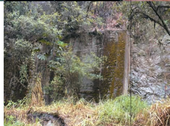
Ruinas del Campamento Minero

Sorprendentes paisajes naturales y maravillosas plantas multicolores dan la bienvenida a las no explotadas Minas de Marmol ubicadas a 4 horas de Guasaganda