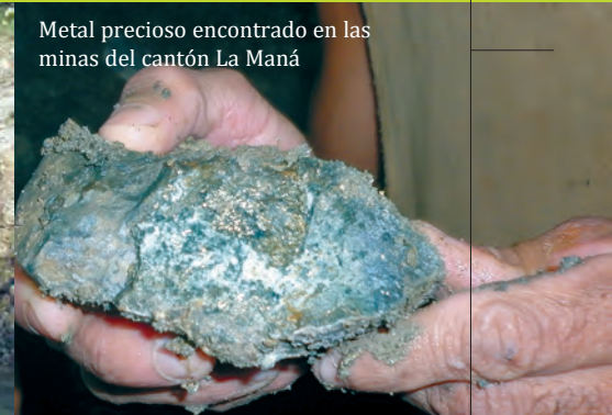
Metal precioso encontrado en las minas del cantón La Maná