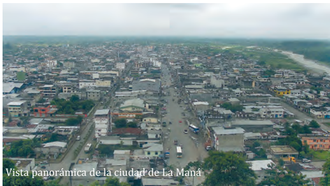
Vista panorámica de la ciudad de La Maná

Datos generales.- La Maná, instituida como cantón hace 29 años, se localiza en la región occidental de las cordillera de los Andes, a una altitud de 800 msnm y a 150 Km de la ciudad de Latacunga, disponiendo por su estratégica ubicación geográfica de inmensos bosques, gigantescas siembras de