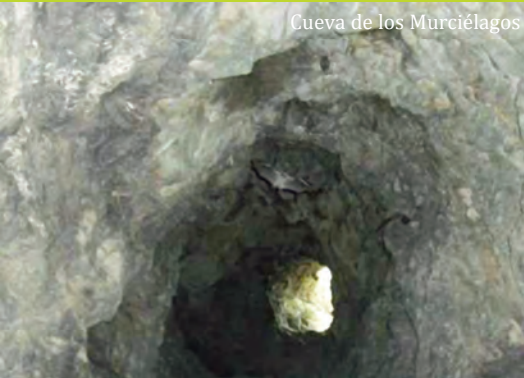
Cueva de los Murciélagos