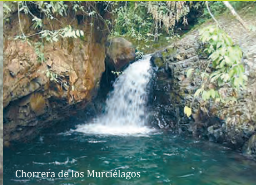
Chorrera de Los Murciélagos