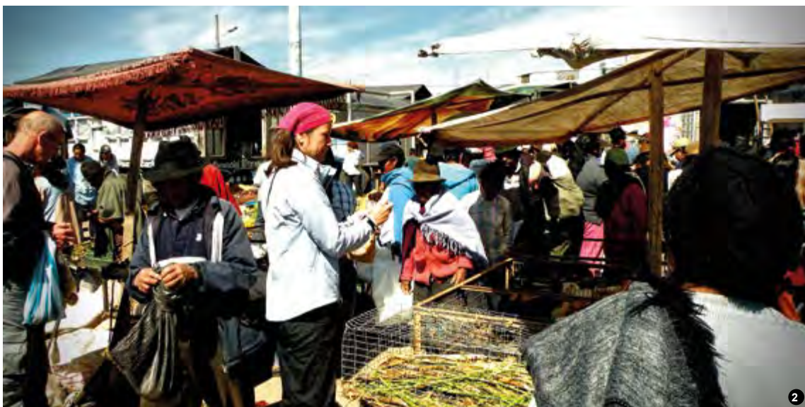
1. Vista panorámica del Parque Central de Saquisilí | Panoramic view of Central Park Saquisilí. 2. Turismo, arte y cultura confluyen a la Feria de Saquisilí | Tourism, art and culture converge to Saquisilí Fair. 3. Piedra de Wingopana | Wingopana Stone.

2. Piedra de Wingopana. - Este hito natural rocoso de fácil acceso se encuentra ubicado a