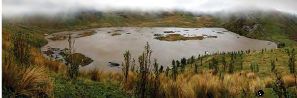
4. Cascada de Candela Fazo | Waterfall Candela Fazo. 6. El Danzante de Saquisilí | The Dancer Saquisilí .