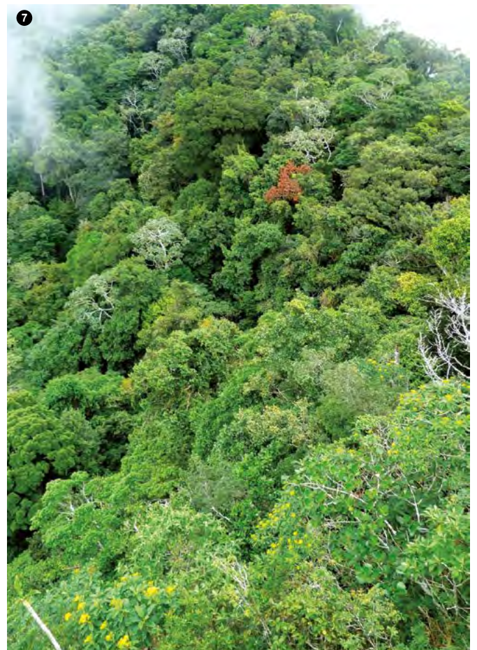
4. The Mayor of Ecuador Cascada "San Rafael" in the Cayambe Coca | The Mayor of Ecuador Cascada "San Rafael" in the Cayambe Coca 5. Reserva Ecológica Cayambe Coca | Cayambe Coca Ecological Reserve 6. El Oso de Anteojos | The Spectacled Bear 7. El Dosel | The Dosel .